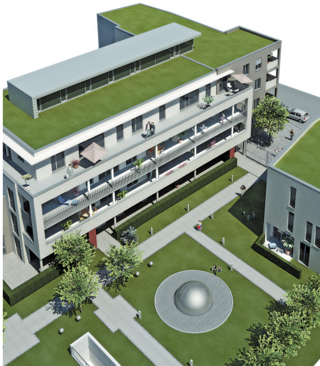
Innen wie außen vom Feinsten: Die neue Wohnanlage „Schwalbeneck“, die im Domviertel entstehen wird.